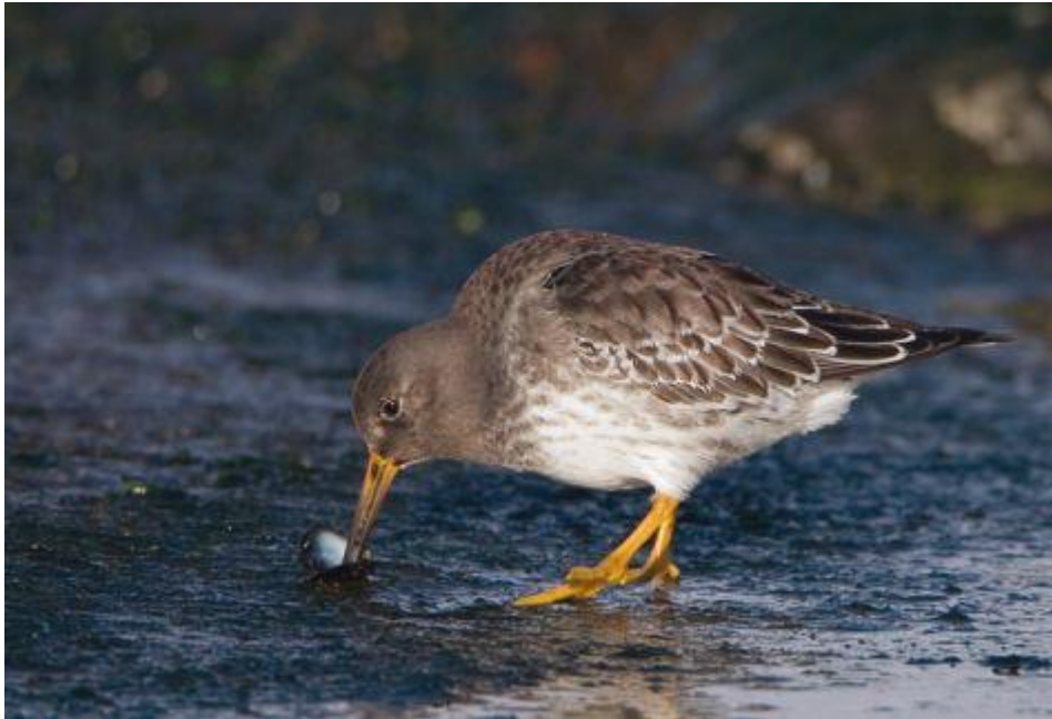
Paarse strandloper eet mosseltje

Holland. In de Delta vind je ze op de Brouwersdam, de Westkapelse Zeedijk en bij Breskens en Cadzand. Op de Waddeneilanden vind je ze vooral op strekdammen, zoals op Vlieland en op de Eierlandse Dam op Texel. Op de vaste verblijfplaatsen worden, zo blijkt uit onderzoek met kleurringen, vaak maandenlang en van jaar op jaar dezelfde individuen aangetroffen. In het binnenland is een paarse strandloper erg zeldzaam.