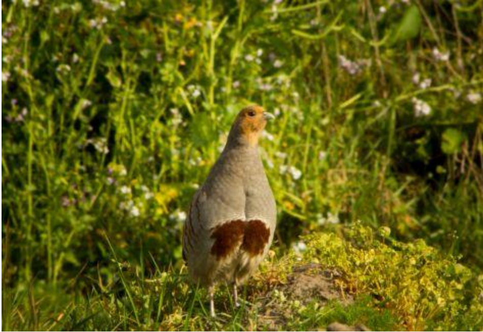
Patrijs bij akkerrand

Het boerenland van de Achterhoek behoort van oudsher tot de belangrijkste broedgebieden van patrijzen in Nederland. Maar ook hier ging de patrijs keihard achteruit. Vijf partijen sloegen met het project 'Samen voor de patrijs in Aalten' in 2013 met succes de handen in elkaar: de Agrarische natuurvereniging PAN, Vogelbescherming Nederland, Vogelwerkgroep Zuidoost Achterhoek, gemeente Aalten en Wildbeheereenheid Aalten en omstreken.