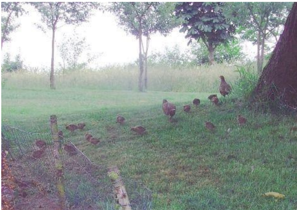
Groep patrijzen

Een comeback van formaat. Rondom de buurtschappen Barlo en Dale zaten in 2011 nog maar 3 paar patrijzen. "In 2014 bleken er al 25 paar te broeden. En dit jaar zelfs 34!", aldus Ter Bogt. "En dat is nog niet alles: de patrijzen zwermen ook uit naar de omliggende gebieden. Het aantal paren is niet alleen in de hele gemeente Aalten toegenomen, maar ook in de buurgemeenten Winterswijk, Oost-Gelre en Oude IJsselstreek."