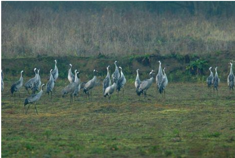
Kraanvogels in de Ooijpolder bij Nijmegen

In de al langer bezette gebieden kwamen dit jaar meer kraanvogels tot broeden. In het Fochteloërveen nestelden maar liefst negen paren en in het Dwingelderveld twee. Territoriale, maar (nog) niet broedende paren zijn op verschillende plekken in Oost- en Zuid-Nederland vastgesteld