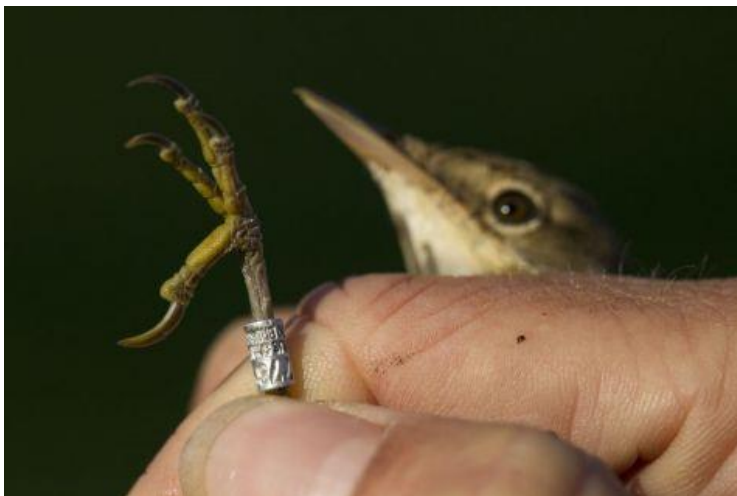
Gevangen kleine karekiet met ring

Trekkende zangvogels zoals de kleine karekiet zijn in de gebieden waar ze overwinteren erg afhankelijk van het voedselaanbod. Nederlandse kleine karekieten overwinteren waarschijnlijk voor het grootste deel in de mangrovebossen langs de kust van Senegal tot aan Guinea-Bissau, zo is onlangs gebleken uit intensief telwerk in deze gebieden. Als er in de Sahel weinig regen valt in de nazomer en het najaar, geldt dat doorgaans ook voor de West-Afrikaanse kust. Droge seizoenen pakken negatief uit voor kleine karekieten, die in de winter problemen krijgen met het aanleggen van een vetvoorraad voor de voorjaars trek. Door de droogte zijn er dan simpelweg te weinig insecten te vinden.