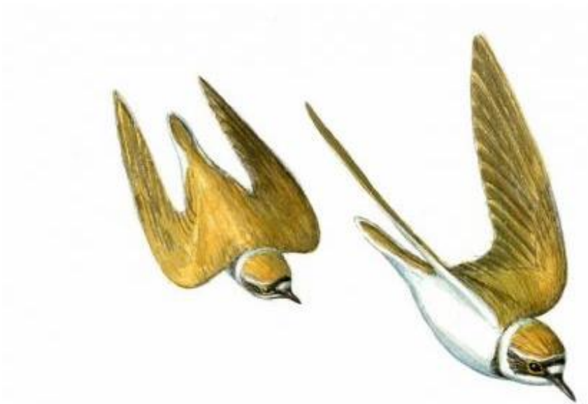
Kleine plevieren

Vorig jaar werd de Loozerheide bij Weert ingericht. Op de plek waar eerst akkers lagen, ligt nu een ven tussen begraasde graslanden en schralere heidevelden. Het ven trekt met zijn kale oevers pioniervogels zoals bergeenden en kleine plevieren aan. Deze vogels houden van het kale open landschap en gaan er vast en zeker een aantal jaren broeden. Ook bijzondere doortrekkers ontdekken het gebied, tussen de verschillende soorten steltlopers werden zelfs steltkluten gezien. Naarmate het gebied zich verder ontwikkelt zullen deze pioniers voor een groot deel weer verdwijnen.