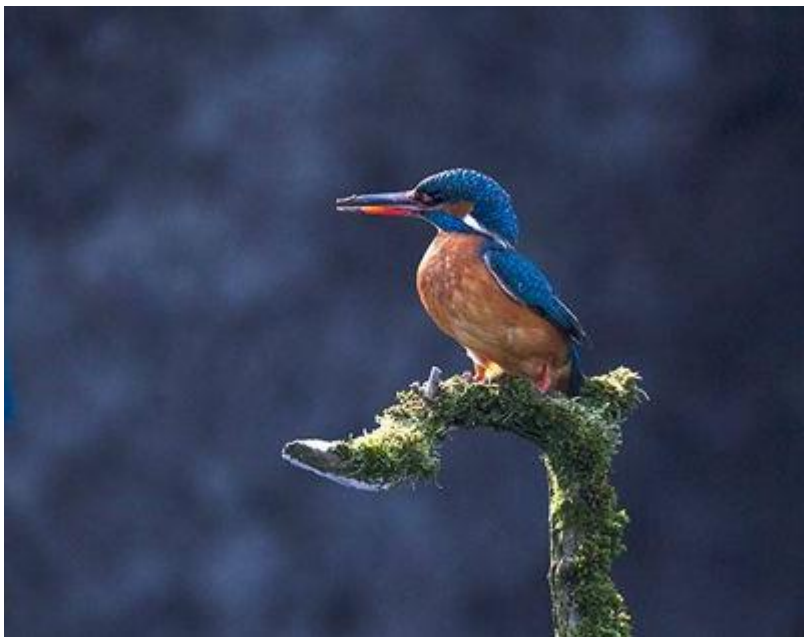
Ijsvogelvrouwtje op de voorgrond en mannetje linksachter bij hol. Ooijpolder, 9 april 2015

Vanaf een punt met mooi uitzicht binnen een kwartiertje vijf verschillende ijsvogels zien...dat gebeurt niet vaak. Maar momenteel is het voor bofkonten mogelijk