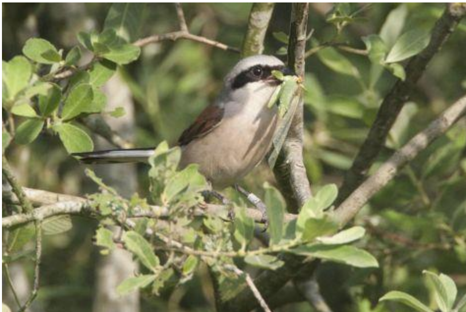
Grauwe klauwier man

Een viewer toont de aanwezigheid van een vogelsoort binnen een gekozen tijdsperiode, bijvoorbeeld een week. Daarmee wordt inzichtelijk gemaakt hoe vogelsoorten zich door Europa bewegen. Het levert fascinerende beelden op, alleen mogelijk dankzij de hulp van tienduizenden waarnemers in heel Europa.