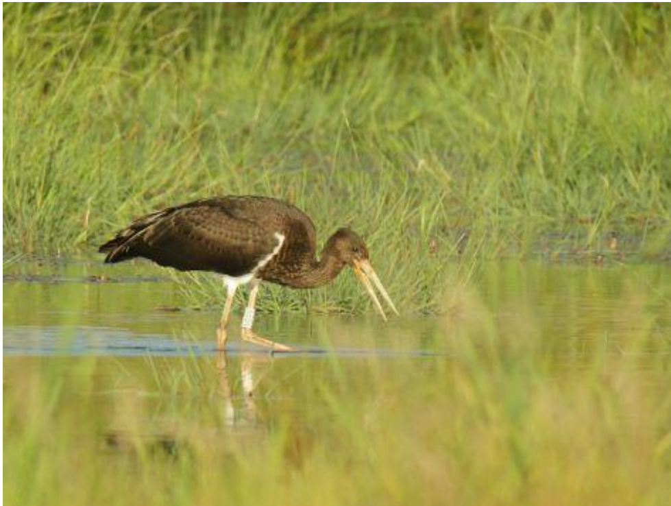
Zwarte ooievaar

De Kettingdijk maakt deel uit van het grensoverschrijdende natuurgebied Kempen~Broek. Het kletsnatte gebied ligt ingeklemd tussen de gortdroge Laurabossen en de Belgische grens. Tot in de negentiende eeuw was het een groot moerasgebied. Daarna werd het ontwaterd om er landbouwgrond van te maken. In 2014 is het gebied opnieuw op de schop gegaan en sindsdien onderging het een ware metamorfose. Het voormalige agrarische gebied bestond uit akkers en weilanden. Hier is eind 2014 een toplaag van 30 tot 40 centimeter bemeste grond afgegraven. Hierdoor zijn bodemlagen uit de negentiende eeuw weer aan de oppervlakte gekomen. Dit zijn veenachtige gronden met een leemachtige onderlaag, waardoor het water op de oppervlakte blijft staan. Ook is de waterhuishouding aangepast. Het slotenstelsel voor snelle afvoer van voedselrijk landbouwwater is helemaal aangepast. Superschoon regenwater en kwelwater uit zuidelijker gelegen gebieden vormen nu de basis voor de nieuwe, nattere natuur.