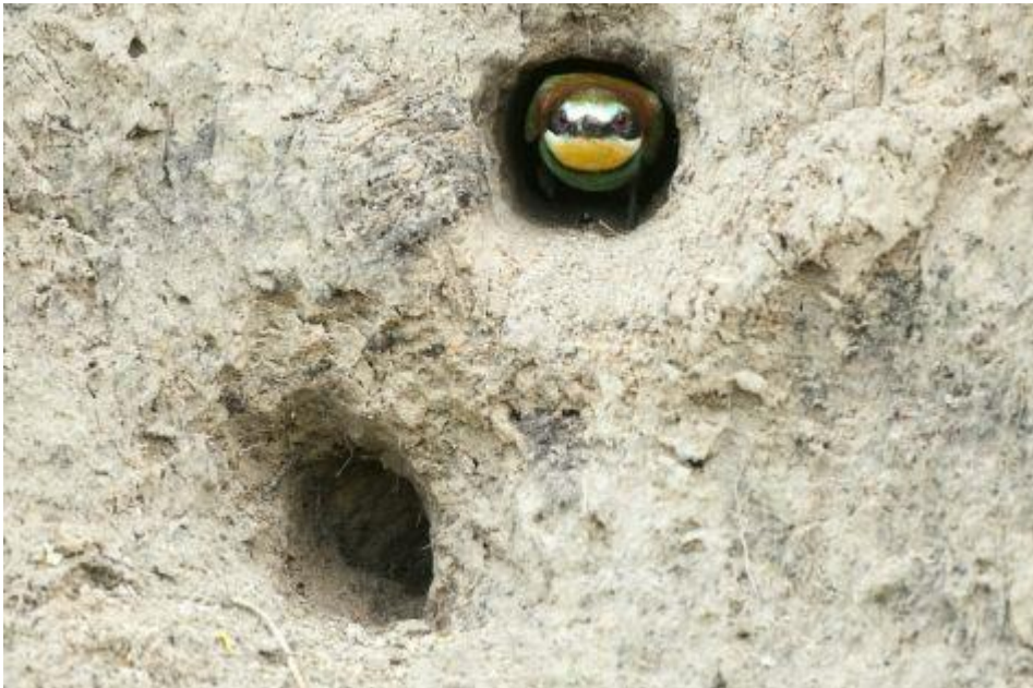
Bijeneter komt uit nestingang

Ook dit jaar stromen de waarnemingen van bijeneters alweer binnen, met name in de duinen. Het is een inmiddels vertrouwd beeld. In het voorjaar komen de bijeneters vooral via de kuststrook het land binnen en worden daar de meeste waarnemingen gedaan. In het najaar worden de meeste bijeneters juist in het binnenland gezien. “Toch zegt dat niets over waar de bijeneters gaan broeden, dat kan echt in heel Nederland zijn”, aldus Koster. “De broedgevallen die we kennen zijn over het hele land verspreid, van de duinen tot in Limburg, maar ook in Overijssel, Drenthe, Groningen en in Flevoland. Zolang de omstandigheden goed zijn, kunnen ze overal opduiken. Een goed leefgebied voor de bijeneter moet wel aan een paar voorwaarden voldoen: het liefst met veel bloemen, water in de buurt en begrazing door vee. Dat garandeert veel insecten. En uiteraard moeten er ook zandbulten, steile wanden of oeverwallen in de buurt zijn waarin ze kunnen nestelen.”