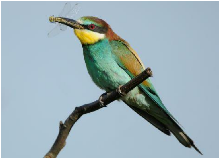
Bijeneter met libelle

Het is een van de mooist gekleurde vogels die Europa rijk is: de bijeneter. Steeds vaker zien we dit vliegende juweel verschijnen in Nederland en de laatste jaren broedt de bijeneter ook in Nederland. Ook dit jaar zijn ze alweer gezien in de duinen. Maar is de bijeneter een blijvertje?