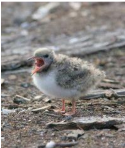
Visdief jong

Het hoofdvoedsel van visdieven in het IJsselmeer is spiering en met name in het jaar 2009 waren er sterke aanwijzingen dat er een tekort was aan spiering van het juiste formaat. De voedselsituatie is sinds die tijd in het IJsselmeer niet gunstig voor visdieven.