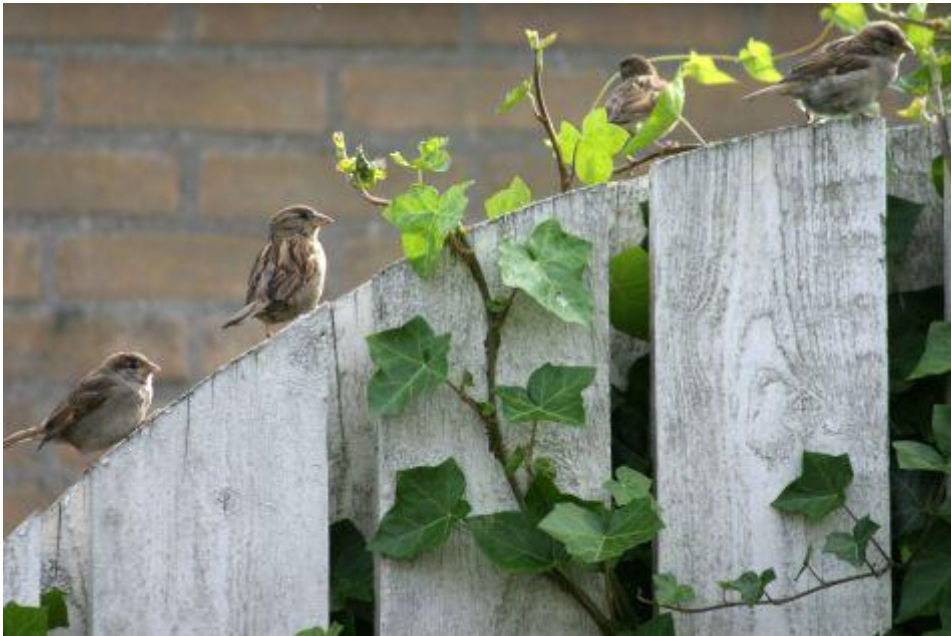
Jonge huismussen op schutting

Vanaf de eeuwwisseling is de grote afname gestopt. De populatie in stedelijk gebied is nu stabiel. Daarmee doet de huismus het beter dan de spreeuw, waarvan de aantallen in stedelijk gebied nog steeds afnemen. Stabiliserende aantallen huismussen, na eerdere afname, zijn overigens ook uit Engeland gemeld.