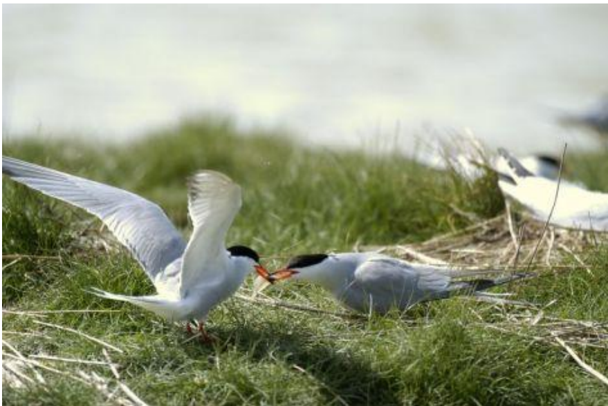
Volwassen visdief voedt jong

Het opgespoten eiland 'de Kreupel' in het IJsselmeer herbergt de grootste kolonie visdieven van Europa, bijna een kwart van de totale Nederlandse populatie. Sinds 2003, tijdens de aanlegfase van de Kreupel, vestigde zich een kolonie visdieven op het eiland, nog tussen de graafmachines. Door import van naburige IJsselmeerkolonies en in beperkte mate vanuit de Waddenzee, namen de aantallen snel toe tot ongeveer 7000 paar in 2010. Dat zijn er heel veel, maar jammer genoeg brengen de visdieven de afgelopen jaren nauwelijks jongen groot. Bureau Waardenburg onderzoekt met ondersteuning van vogelringgroep de Kreupel en Staatsbosbeheer de oorzaken. Het onderzoek wordt mede mogelijk gemaakt door Vogelbescherming.