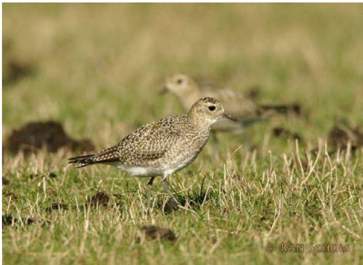
Goudplevieren foerageren op wormen in het grasland

De midwintertelling van 2013 leverde in totaal 5,2 miljoen watervogels op. Dat waren er weliswaar een dikke 400.000 minder dan het jaar ervoor, maar desondanks was het het op twee na beste resultaat ooit. Vorig jaar viel het telweekend precies voor een overgang naar zeer koud winterweer. Tijdens de telling was het zonnig en stond er weinig wind, ideaal weer dus. Het milde weer zorgde ervoor dat soorten zoals Kievit en Goudplevier en grondeleenden zoals Wintertaling en Slobeend relatief goed scoorden.