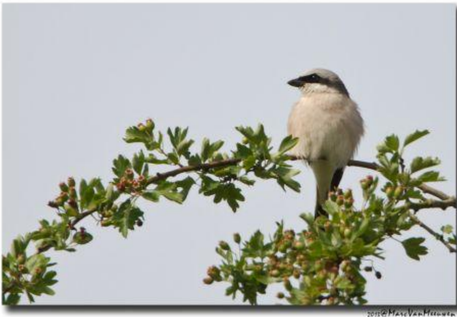
Mannetje Grauwe Klauwier op een meidoorntak

Sinds 2011 werkt ARK in opdracht van de provincie Limburg onder andere in de gemeente Vaals aan een project voor gebiedsontwikkeling. Dit gebeurt in het kader van het meerjarenprogramma plattelandsontwikkeling van de provincie Limburg. Door middel van vrijwillige kavelruil kunnen we graslanden en akkers aankopen. Zo geeft ARK invulling aan het Natuurnetwerk Nederland (ook bekend als Ecologische Hoofdstructuur). Dit netwerk moet natuurgebieden beter verbinden, met elkaar en met het omliggende agrarische gebied.