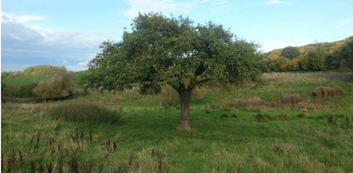
Ruige graslanden en struwelen in Drielandenpark bij Vaals

De natuurgebieden hebben in drie jaar tijd een opmerkelijke gedaantewisseling ondergaan. Waar voorheen voornamelijk enkele soorten gras groeiden, bloeien nu honderden soorten bloemen en struiken. Op deze afwisseling zijn grote aantallen sprinkhanen, kevers, vlinders en andere insecten afgekomen. En juist deze insecten vormen het belangrijkste bestanddeel van het voedsel van grauwe klauwieren.