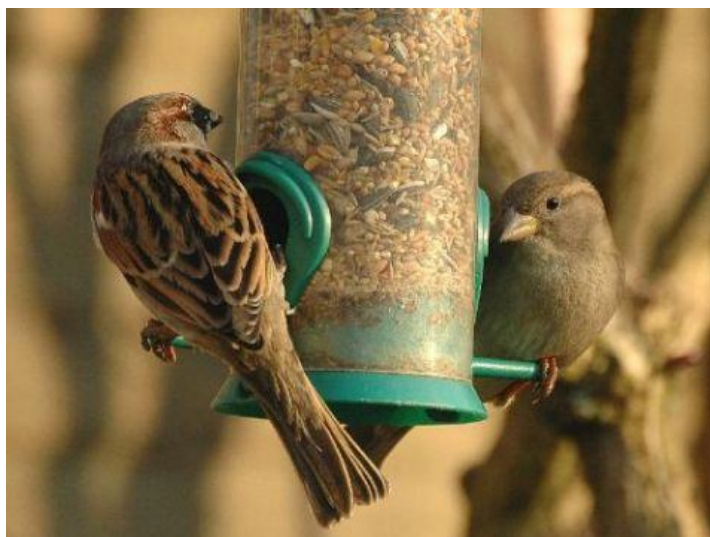
Huismussen op voedersilo

Opnieuw staat de huismus op nummer één in de Nationale Tuinvogeltelling. Dat betekent niet dat deze vogel ook in de meeste tuinen is gezien: hij werd in minder dan de helft van de tuinen geteld. De reden dat deze vogel op één staat is omdat de huismus in grote groepen leeft.