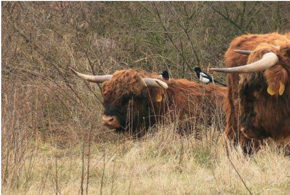
Eksters op de rug van een Schotse Hooglander stier

Eksters scharrelen het liefst op zoek naar insecten en larven. Dierlijk voedsel staat dan ook bovenaan zijn menu. In het voorjaar en tijdens de zomer vindt hij volop dierlijk voedsel, maar juist nu is deze voedselbron zeldzaam geworden. 's Winters schakelt hij deels over op plantaardig voedsel, maar als het even kan heeft hij liever wat dierlijke vetten op zijn menu. Een dikke teek uit de vacht van een grote grazer zal hij nu zeker niet overslaan.