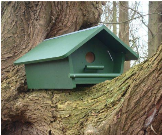
Marterproof nestkast voor steenuilen

van de nestkast te maken. Het prototype werd getest met tamme steenmarters: die konden er niet in. Steenuilen wél.